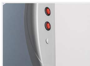
Interuttori indipendenti per le luci interni e per l'opalina