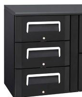
Set di 3 cassetti disponibili separatamente