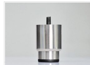
Piede in acciaio inox regolabile