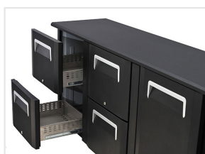
Set di 2 cassetti disponibili separatamente