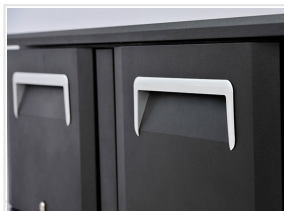
Maniglia schiumata nella porta